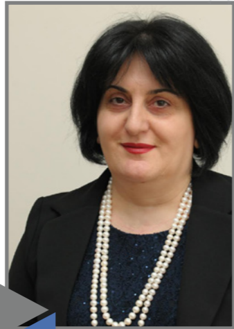
ADDRESS OF THE CHIEF EXECUTIVE OFFICER

2017 წელი მრავალფეროვანი და დატვირთული იყო სხვა სიახლეებითაც, აღსანიშნავია, რომ ბანკი ქართუ აპრილში