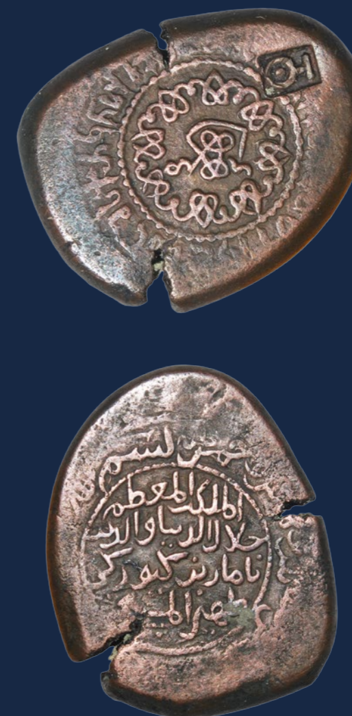
თამარი - მოწმობა 1187 წელსაა მოჭრილი TAMAR – COIN DATED WITH 1187

სპილენძის მონეტის ერთ მხარეს კარგად იკითხება თამარის ხელრთვა: „თამარ“ და ქართული წარწერა. მონეტის მეორე მხარეს, ე.წ. „ზურგზე“ არაბულად ვკითხულობთ „დედოფალი დიდებული“, მშვენიერა ქვეყნისა და სარწმუნოებისა თამარ, ასული გიორგისა, მესიის თაყვანისმცემელი. განადიდოს ღმერთმან ძლევათი მისნი, განადიდოს ღმერთმან დიდება მისი, განაგრძოს ჩრდილი მისი და განამტკიცოს კეთილდღეობა მისი“.