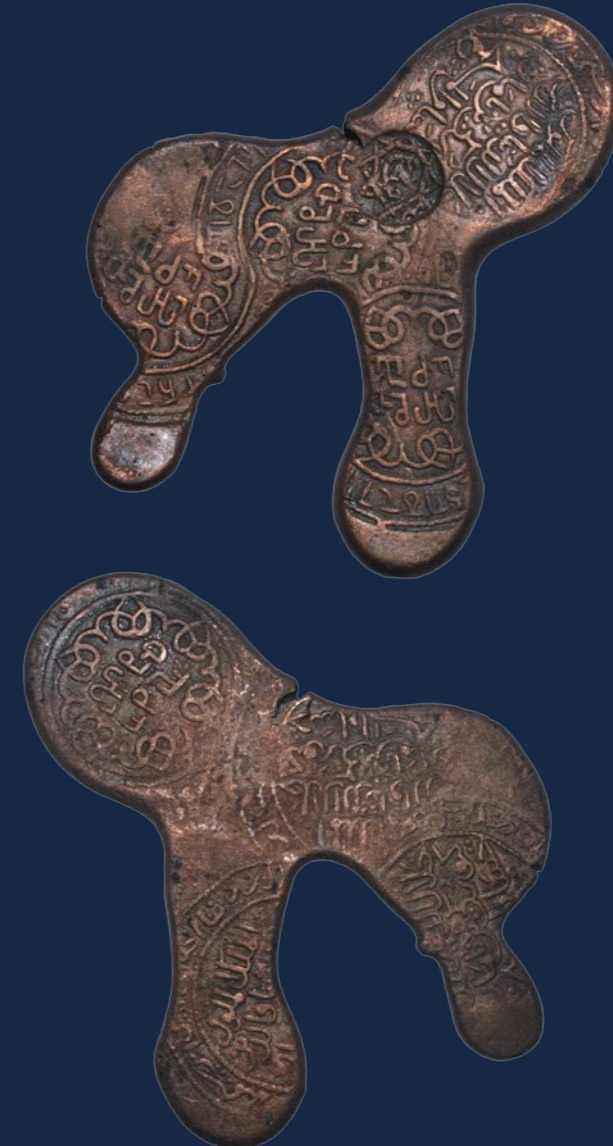
გიორგი მეოთხე ლაშა (ლაშა-გიორგი) GIORGI IV LASHA (LASHA-GIORGI)

მონეტა 1210 წელსაა მოჭრილი და სპილენძისგანაა დამზადებული.