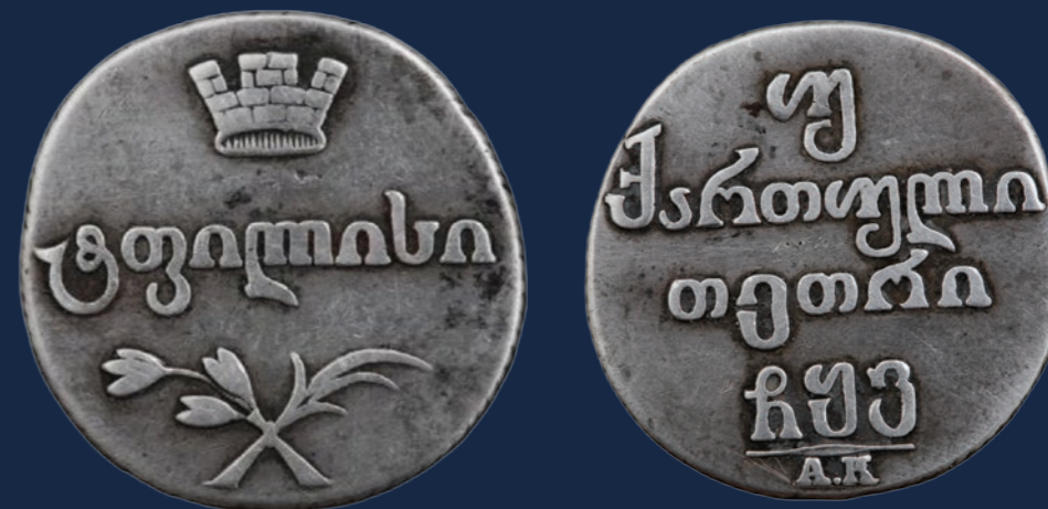
ორი აბაზი. ვერცხლი. თბილისი. 1806 წ. TWO ABAZIS. SILVER. TBILISI. 1806

The coin forged in 1200 during the reign of Queen Tamar and David Soslan, her husband. On the one side, it bears the initials of Tamar and David. The legends in Georgian and Hebrew say: “Queen of queens, the beauty of the land and the faith, Tamar, daughter of Giorgi and the adorer of the Messiah”.